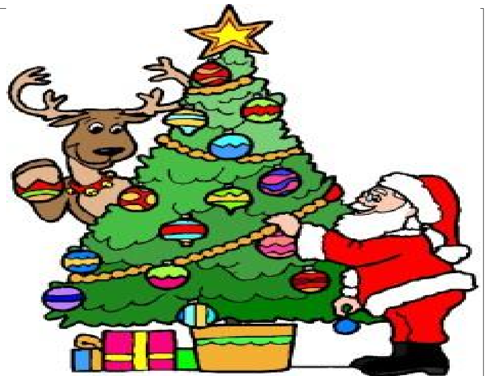
Weihnachten und Nikolaus