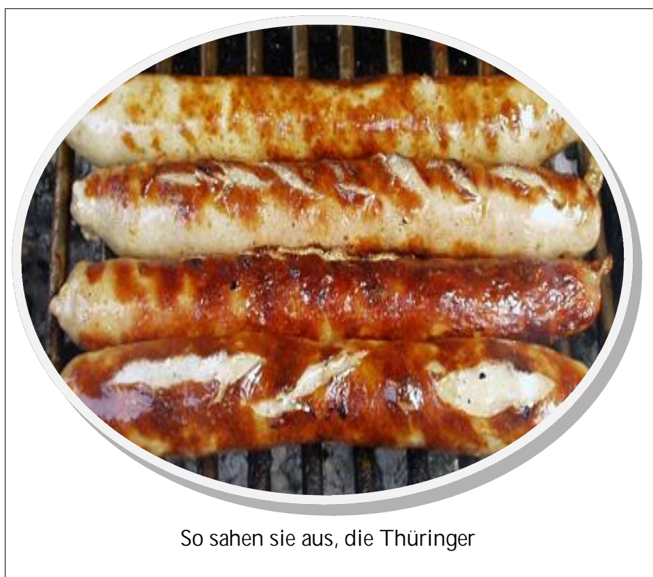
So sahen sie aus, die Thüringer