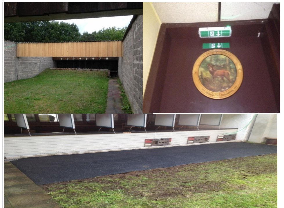
Wir haben es fast geschafft

Es ist fast geschafft. Das Jahr 2013 ist das Jahr mit nahezu den höchsten Investitionen gegenüber den vergangenen Jahren. Dabei waren es weniger die geplanten Maßnahmen, die auch teurer als erwartet waren, sondern eine Vielzahl kleinerer Dinge, die unser Budget belastet haben. Eine Reihe von Reparaturen standen an, wie z.B. die Wasserversorgung, Neuanspflanzung der Bäume auf dem Bogenplatz, Erneuerung der Blenden etc.etc. Natürlich forderten auch die notwendigen Vorbereitungen in Bezug auf die neuen Schießstandrichtlinien ihren Tribut. Kein Wunder, daß unser Kassenwart ein paar graue Haare mehr auf seinem Kopf fand.